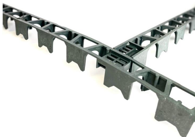
Figure 1 : Vue 3D